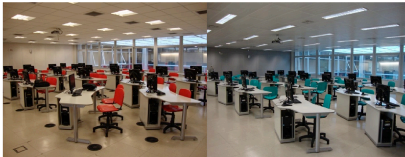
Figura 2: Salas de aula objeto de estudo (Sala 17 e Sala 23)

Visto que as leituras nos sensores são efetuadas a cada 30 s, uma considerável massa de dados está disponível online . A partir do tratamento destes dados, podem-se realizar diversas análises a exemplo de: verificação da adequação das condições ambientais frente aos parâmetros vigentes; comparação dos sistemas de ar condicionado do ponto de vista de eficiência na promoção de concentrações de CO 2 conformes; identificação de padrões de variação das grandezas monitoradas em cada ambiente, ao longo do tempo, em função da ocupação e das estratégias de operação adotadas para cada sistema.